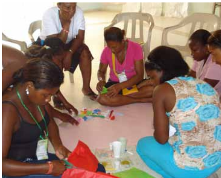
LAS ASESORÍAS BENEFICIAN A PERSONAS CON NEGOCIOS DEDICADOS A LAS MÁS VARIADAS ACTIVIDADES, DESDE LA GASTRONOMÍA HASTA LA JUGUETERÍA.

También se han capacitado a directivos y profesores de escuelas y colegios de las localidades. Gracias a las asesorías, ellos están en capacidad de implementar la educación empresarial en sus instituciones educativas. Así, generan dinámicas empresarial en las regiones. A esta capacitación asistieron 60 docentes en cada municipio.