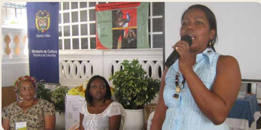
La ex ministra de Cultura Paula Marcela Moreno estuvo presente en el lanzamiento del proyecto Identidad Étnica Cultural de Género y Generacional.

PROYECTOS DE EMPRESARIADO SE LLEVAN A CABO EN DISTINTAS REGIONES DEL PAÍS. LA PARTICIPACIÓN DE SECRETARIOS DE CULTURA DE DIFERENTES DEPARTAMENTOS DE COLOMBIA EN EL LANZAMIENTO CONFIRMA LOS ALCANCES DE ESAS INICIATIVAS.