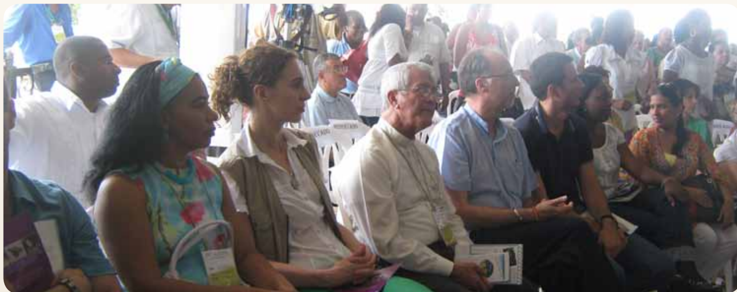
Al lanzamiento asistieron representantes de los más altos organismos de cooperación internacional, así como delegados del gobierno, de instituciones educativas y financieras.

PROYECTOS DE EMPRESARIADO SE LLEVAN A CABO EN DISTINTAS REGIONES DEL PAÍS. LA PARTICIPACIÓN DE SECRETARIOS DE CULTURA DE DIFERENTES DEPARTAMENTOS DE COLOMBIA EN EL LANZAMIENTO CONFIRMA LOS ALCANCES DE ESAS INICIATIVAS.