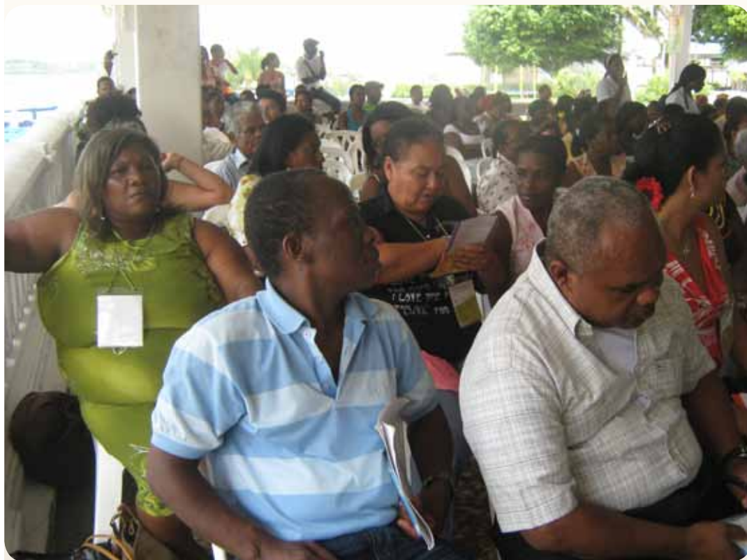
Todos los asistentes tuvieron la oportunidad de exponer sus puntos de vista, a través de una ronda de preguntas y respuestas.

Con este proyecto, la Red Nacional de Mujeres Afrocolombianas Kambirí, se fortalece como una de las organizaciones más importantes en la lucha por el empoderamiento de las mujeres afro, al tiempo que sigue creciendo en la formación de nuevos liderazgos para la población afro de Colombia.