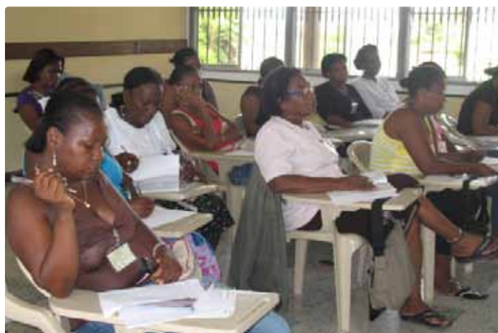
DIRECTIVOS Y DOCENTES DE VARIAS ESCUELAS Y COLEGIOS TAMBIÉN RECIBEN ASESORÍAS SOBRE EL TEMA DE LA EDUCACIÓN EMPRESARIAL.